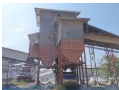
โรงไม้หินของโครงการ