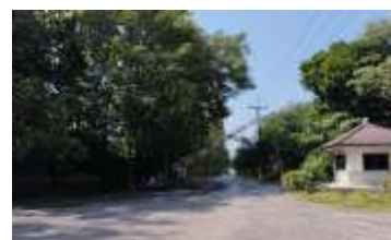
บริเวณด้านหน้าทางเข้า-ออก พื้นที่โครงการ