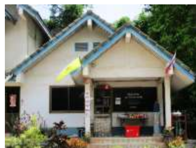
สำนักงานโรงไม้หิน