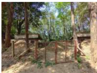
อาคารเก็บวัตถุระเบิด