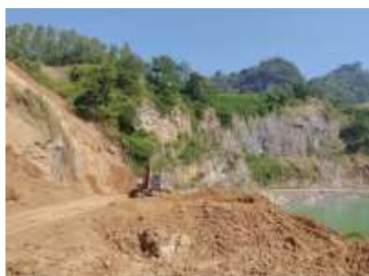
พื้นที่หน้าเมือง