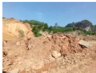
พื้นที่เก็บของเปลือกดิน