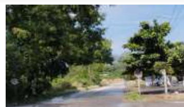
ทางหลวงหมายเลข 1115