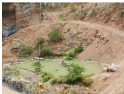
บ่อดักตะกอน